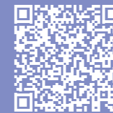
FILM Maschinenbau - Robotic* Centre

Der Maschinenbau erfindet sich an der HTL Anichstraße neu. In einem modernen Robotic* Centre werden Fertigungsabläufe programmiert und Ideen umgesetzt.